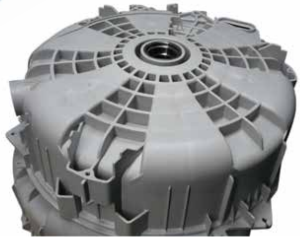
洗衣机的塑料桶—大而复杂形状的塑料桶需要高韧性和高淬透特性的模具钢。