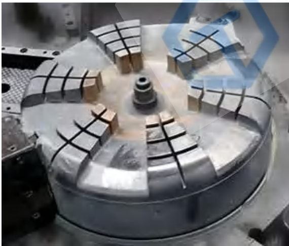
ASSAB 618 T所制成型的洗衣机滚筒核心和铜镀插件。