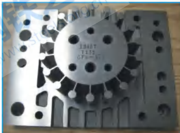
CPM 10V 制成精密零件